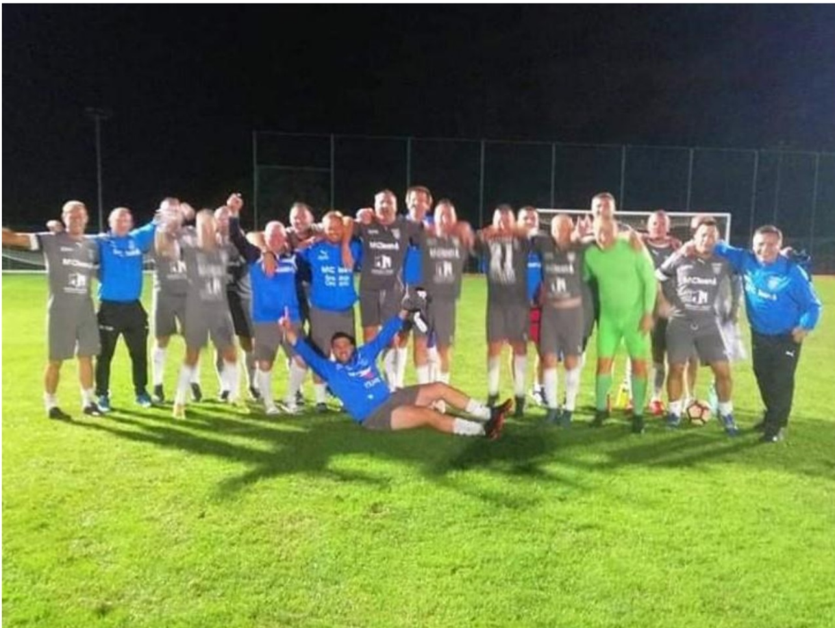
Čestitke ekipi veterana NK Rudar (DZ) na prvom mjestu